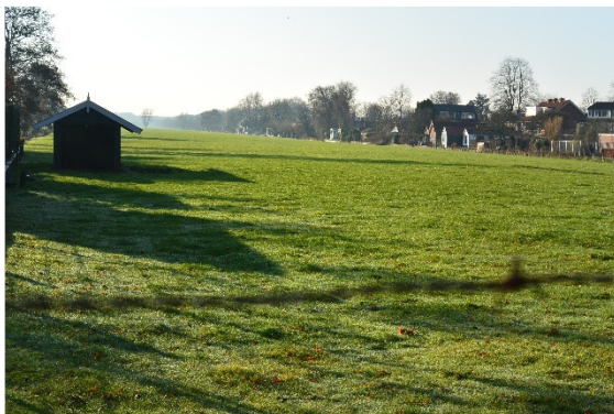
Blik in zuidelijke richting vanaf de Dorpsweg, ter hoogte van huisnr. 170

Het slagenlandschap van deze landerijen heeft in de afgelopen decennia geleden onder de wijze van gebruik, maar de slagen zijn nog steeds goed te herkennen. Als de greppels weer uitgediept worden en met groensingels voorzien, wordt het middeleeuwse landschap ook daar weer goed zichtbaar.