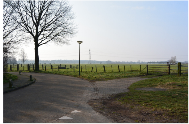
Planetenbaan, blik in zuidelijke richting

Op studies uit 2011 zijn er al rode contouren verlegd. Het gaat vooral om ca. 4 hectare ten zuiden van de Planetenbaan en het Oostveensepad (het fietspad dat parallel aan de A27 loopt). In dit gebied zijn diverse projectontwikkelaars eigenaar van agrarische gronden met als doel, om bij een wijziging bestemming, te gaan bouwen. Ook aan de oostzijde van de Prinsenlaan is in deze studies één ha buiten de rode contouren als zijnde geschikt voor woningbouw aangegeven. Daar de agrarische bestemming van de Prinsenlaan, mede op voordracht van onze stichting in de bestemming "natuur" gewijzigd is, zullen wij ons hard maken om die bestemming te handhaven.