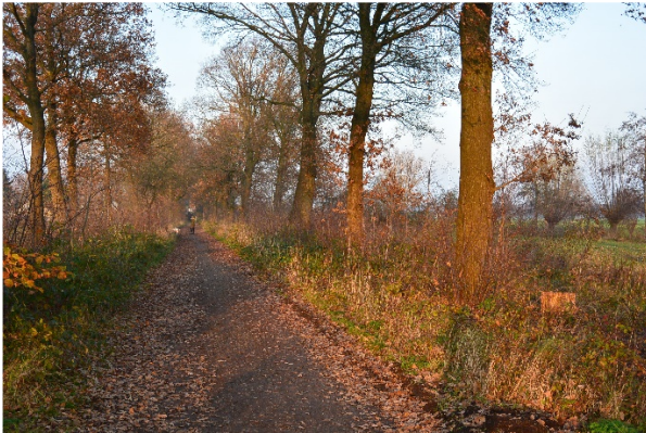
Prinsenlaantje, november 2019